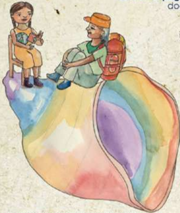
Ilustración Andrea Zambrao Rojas, 2018